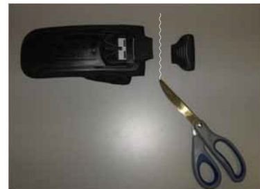
Abb. 1 - Alte (schwarze) Tasche vernichten

**Nicht hörbares Einrasten weist darauf hin, dass die Sperrstifte auf der fixen (verschlussseitigen) Schnalle beim Montageverfahren während der Herstellung beschädigt worden sind.