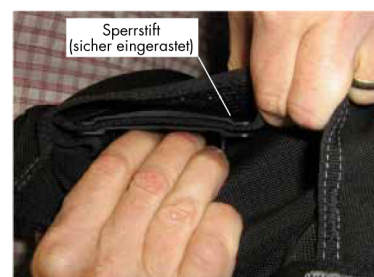
Abb. 3 - An der Schnalle befestigte Abdeckung