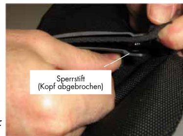
Abb. 4 - Nicht an der Schnalle befestigte Abdeckung