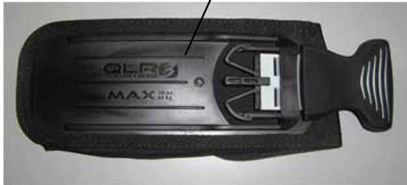
Original QLR3 Trimbleitasche mit schwarzer Verstärkung